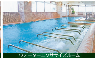
ウォーターエクササイズルーム