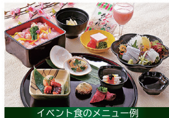
イベント食のメニュー例