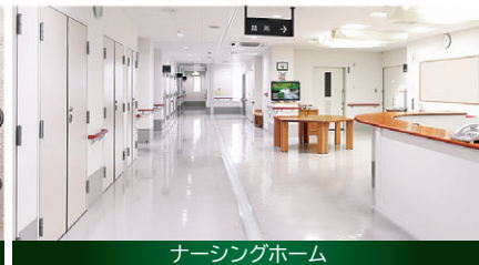
ナーシングホーム